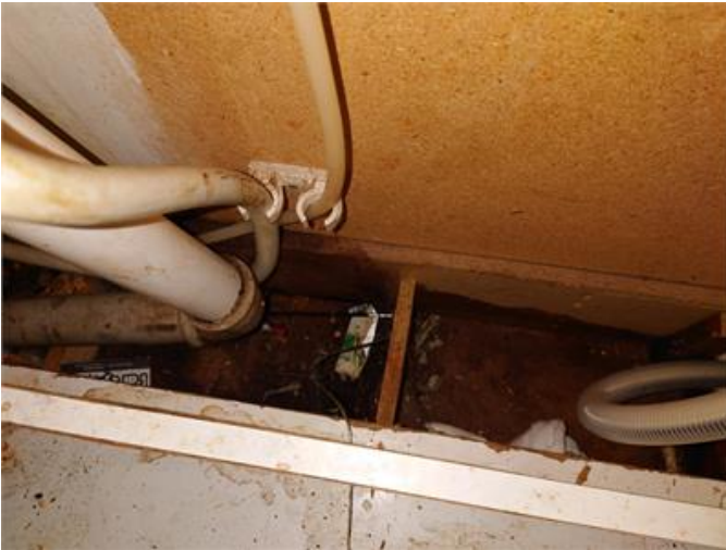
Spår av läckage under diskbänksskåp.