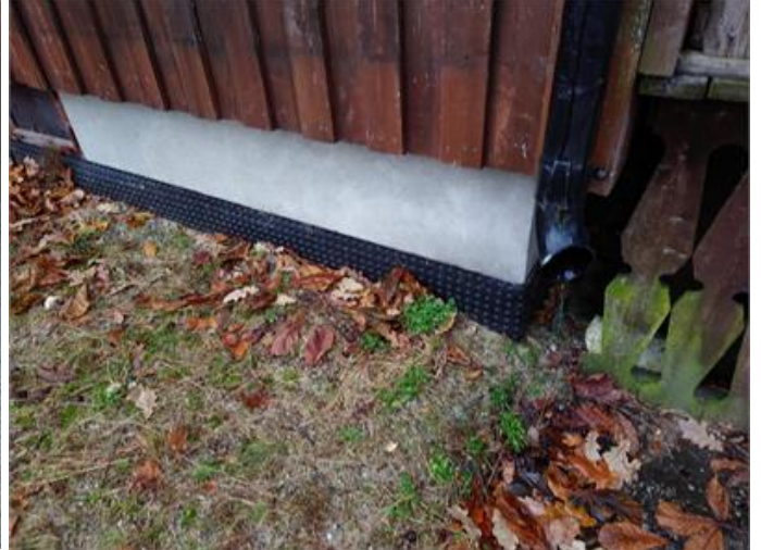
Utvändigt fuktskydd synligt ovan mark.