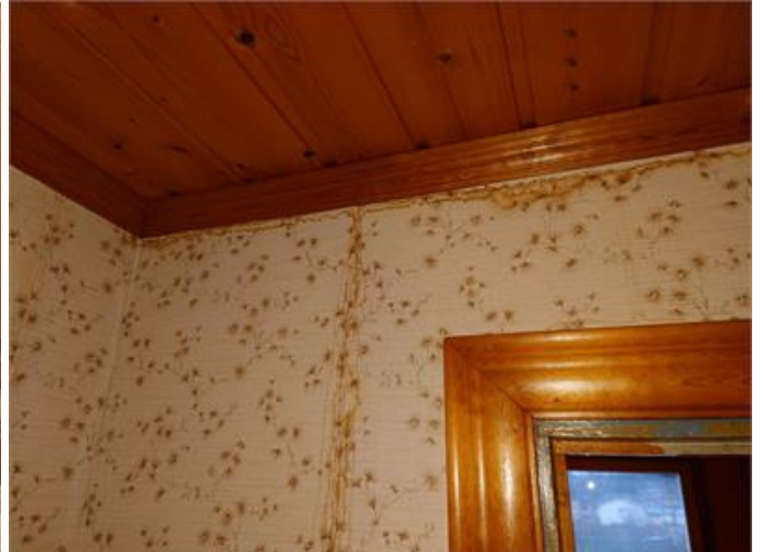
Fuktfläck på vägg i hall på övre plan.