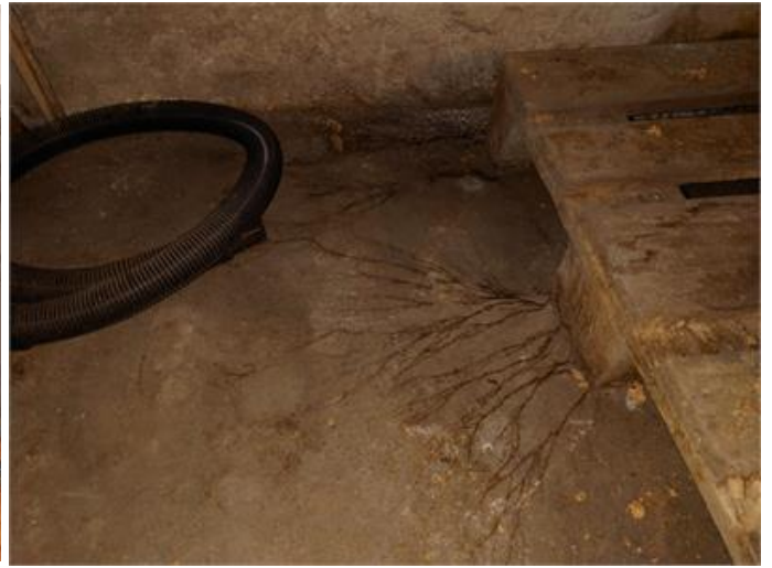
Svampmycel på golv i pannrum.