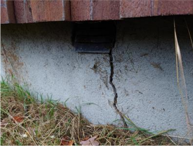
Sättningspricka i grundmur.