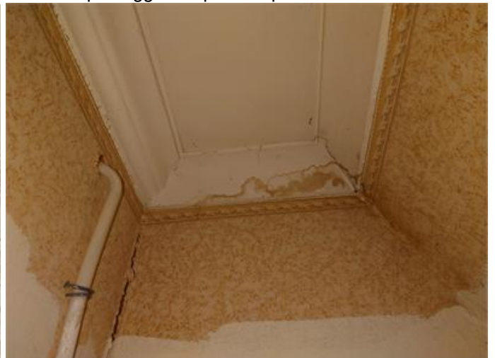
Fuktfläck i tak klädkammare 1.