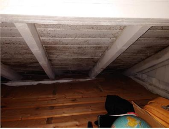
Fuktfläckar/mikrobiell påväxt i underlagstak på vind.