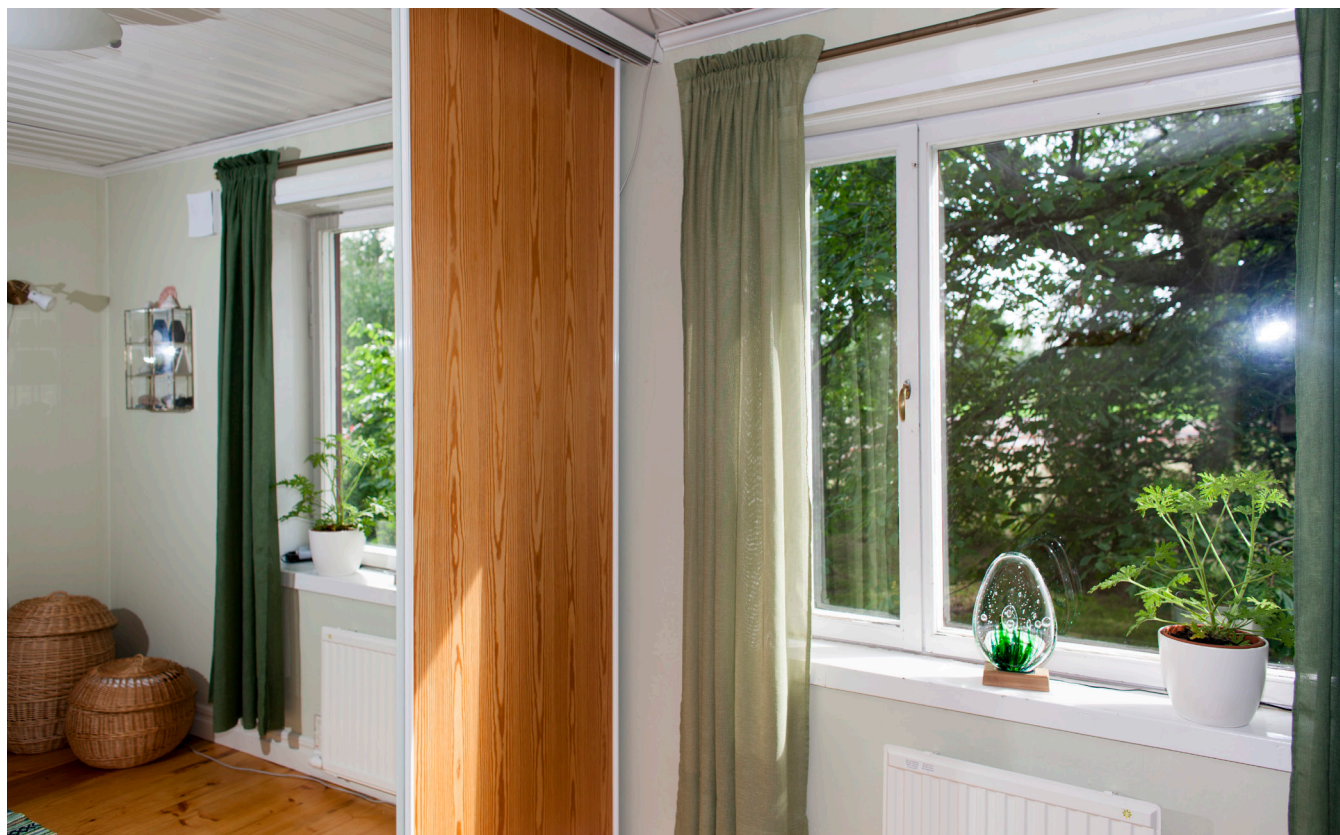
Sovrum med stor klädskammare samt skjutdörrar i garderob.